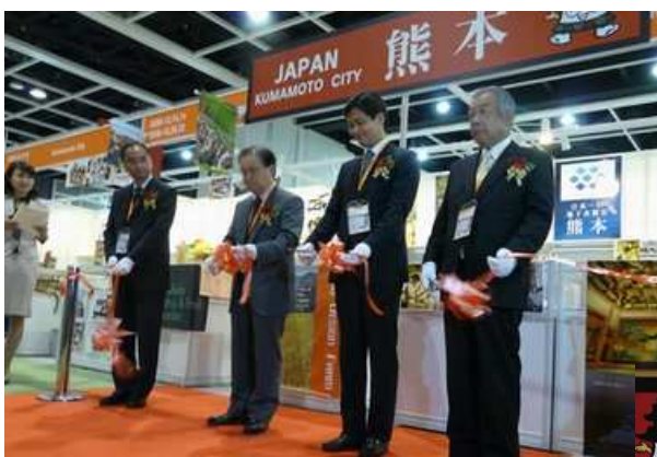
香港国際食品見本市 (Food Expo2009)

※3 出典:行政、JETRO、県貿易協会など公的機関が実施したものに限る(都市圏)。