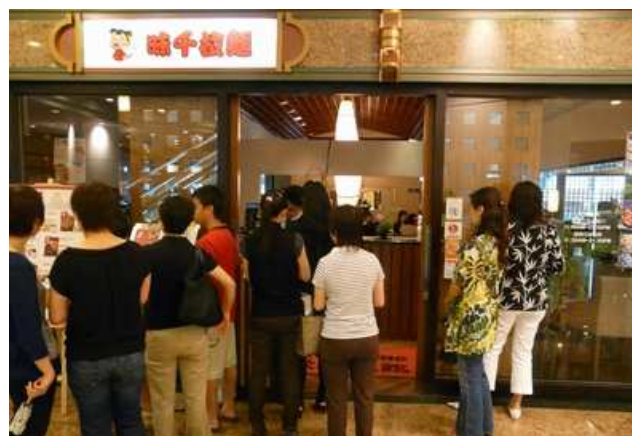
味千ラーメン灣仔新鴻基中心分店(香港)